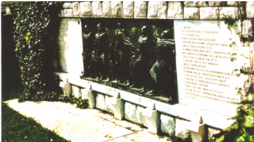
Bassorilievo a Pècs

E con essi svanirono nel dimenticatoio e nell'invisibilità anche i fortunati superstiti della "Legione Redenta in Siberia" - rientrati in Italia solo nel 1920 - ai quali tuttavia il Regime successivamente concesse di fregiarsi con un Distintivo speciale, denominato ironicamente "Distintivo per le Fatiche di Guerra".