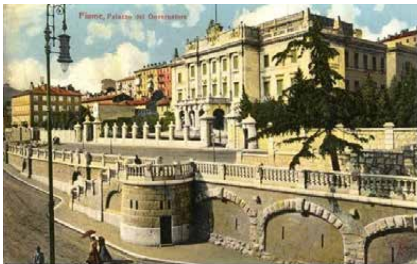
Via Roma e Palazzo del Governatore

C'era sempre qualche difetto nella chiusura del tendone che consentiva di infilarsi passando sotto gli spettatori che stavano seduti sopra le nostre teste mentre gli addetti fingevano di non vedere.