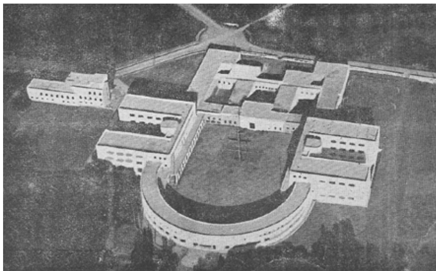
Il Collegio "Niccolò Tommaseo" di Brindisi per studenti profughi giuliano-dalmati.