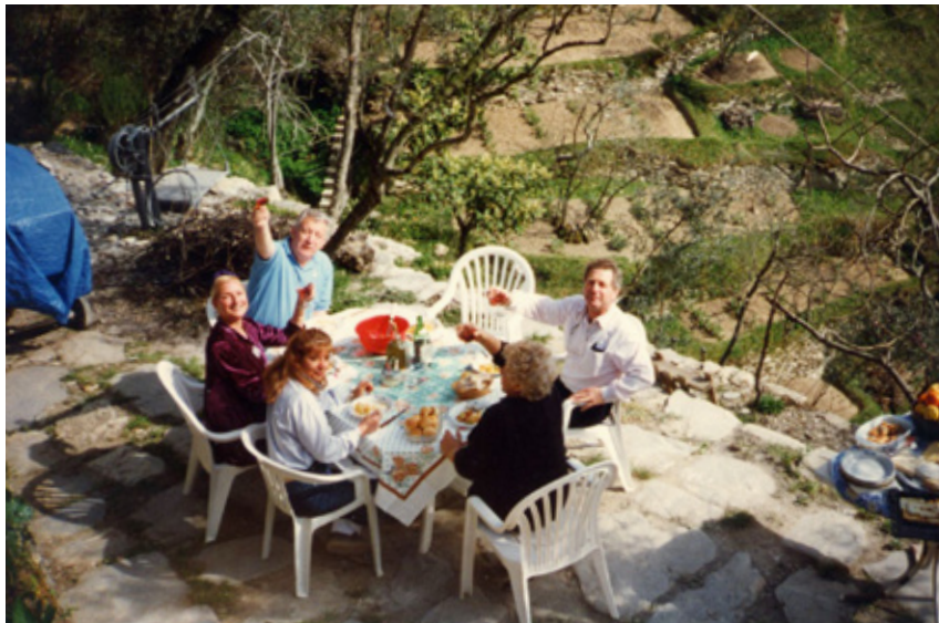
I membri della Giuria Internazionale ospiti all'Eremo.