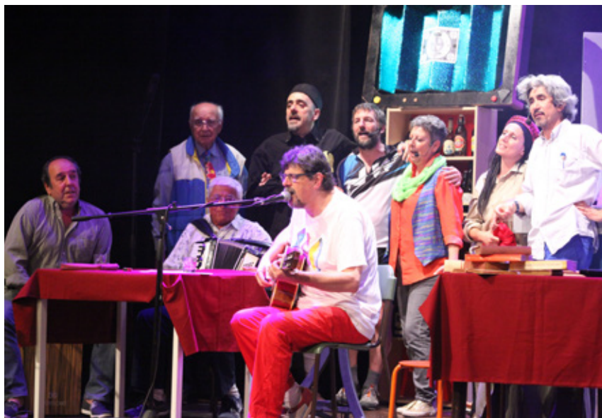
Gran finale di "SOMS che storia" a chiusura della stagione di soriteatro 2016-2017.