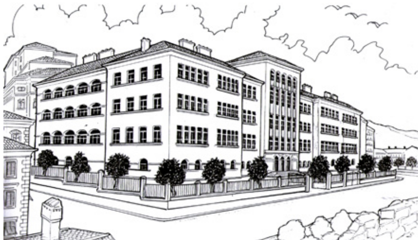
La scuola elementare "Daniele Manin" in un disegno di Ferruccio Comici.