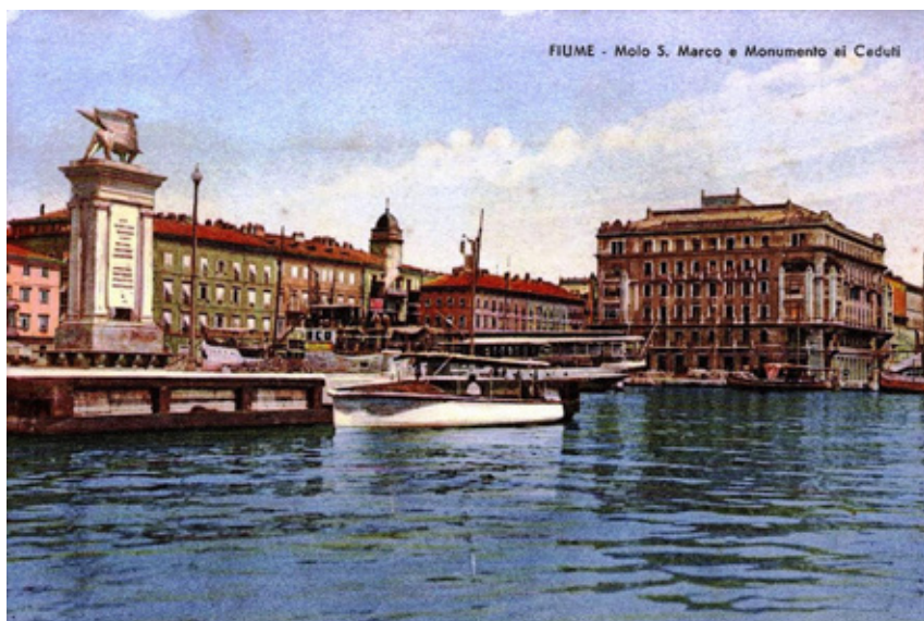
Il Molo San Marco e il motoscafo “Meta” che portava i bagnanti al Bagno Quarnero.