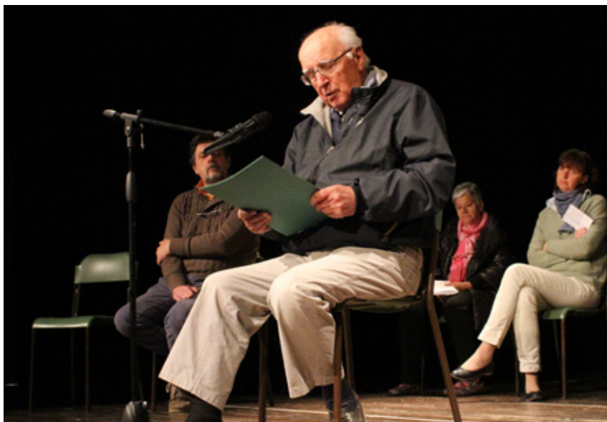
Sul palco del Teatro di Sori per “SORI><IROS autobiografie di una città”.