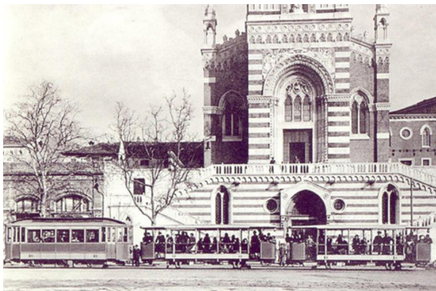
Il tram con le "giardinieri" davanti alla Chiesa dei Cappuccini