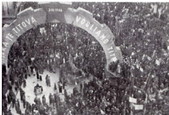
L'Arco di Tito in Piazza Regina Elena