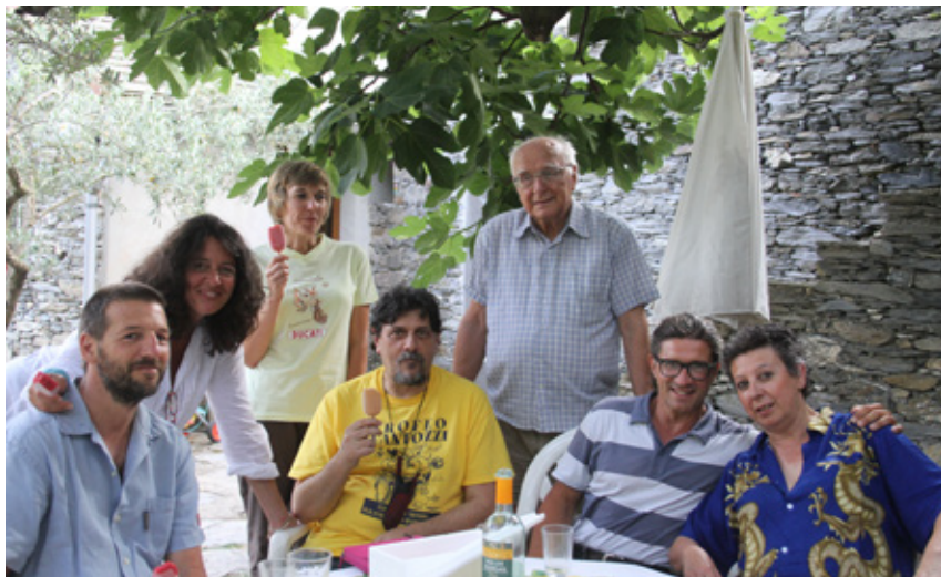
Gli Agitatori Culturali Irrequieti si incontrano nell'Eremo di Rodolfo.