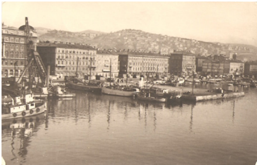
Il Molo Adamich detto anche Molo “Scovazza”

Entravo dalla Sabiza (Piazza Cesare Battisti) che era piena di cavalli, padroncini-cocchieri, carri per fare i trasporti, e servi di piazza (facchini), che con carri a due ruote grandi facevano il servizio di portabagagli dall’adiacente Molo Ancona, dove approdava la nave “Ipparco Bacich” proveniente da Zara, e la Stazione.