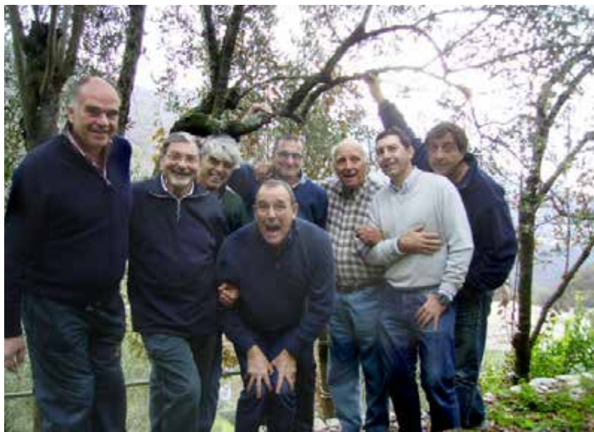
I miei Allievi della Sportiva Quarto, diventati grandi.