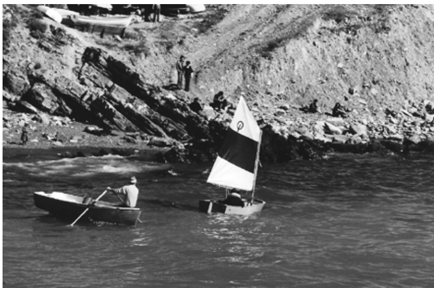
Rodolfo, istruttore di vela un po' speciale. A monte la discesa per i camion che portano i massi per la costruzione del pennello di protezione della spiaggia.