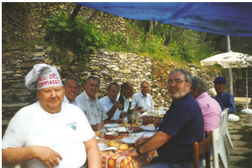
Muli del Tommaseo ospiti all'Eremo.