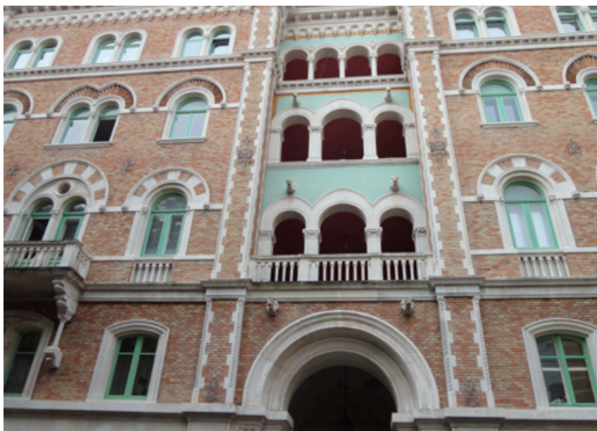
La Casa veneziana di Via de Amicis