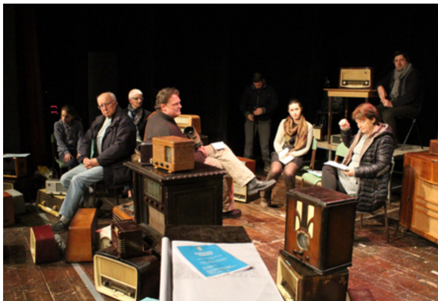
“Le città invisibili” per la stagione di soriteatro 2015-2016.