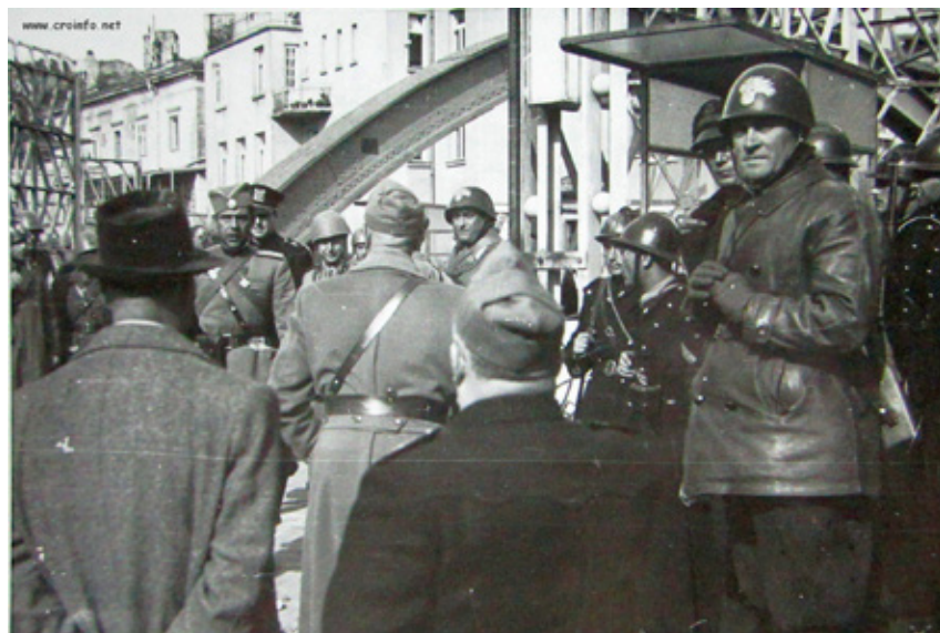
Si sta trattando la resa della città di Sussak.