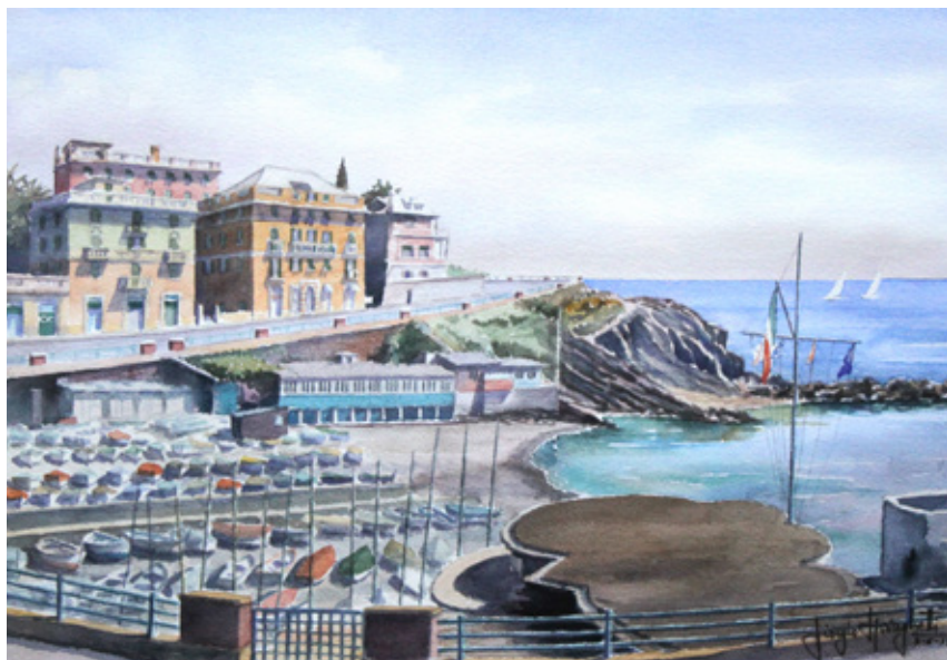
La mia casa sul golfetto di Priaruggia (Acquerello del fiamano Giorgio Springhetti)

Posso quindi affermare di essere stato l'ultimo Direttore di un pezzo della Grande Storia genovese.