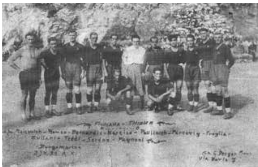
L'Unione Sportiva Fiumana del 1932.

Da quando fu possibile tornare a Fiume sono sempre andato a trovarlo per salutarlo e ricordargli quei tempi eroici prima che spiccasse il volo per la più autorevole “Quarnero”. Lo trovavo immancabilmente in un fondo dalla parte del Teatro vicino al Ristorante “Feral”, intento a giocare a carte con amici. La bozza di bianco non mancava mai. Aveva sempre quell’aria sorniona di quando - ubbriacando i terzini avversari con le sue gambe longilinee manovrate da una fantasia di finte e scatti - insaccava in rete tra il tripudio della “Mularia de Citavecchia”, che fermamente credeva in lui. Oltre il ricordo delle sue gesta sportive, di lui resta questa toccante poesia che scrisse sulla sua difficile infanzia in Calle Arco Roman.