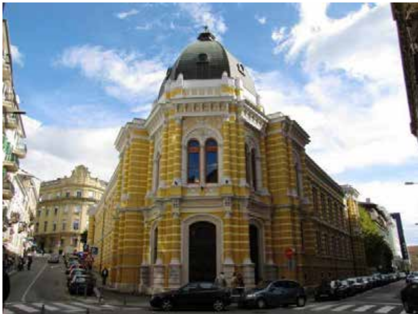
Liceo Scientifico "Antonio Grossich"