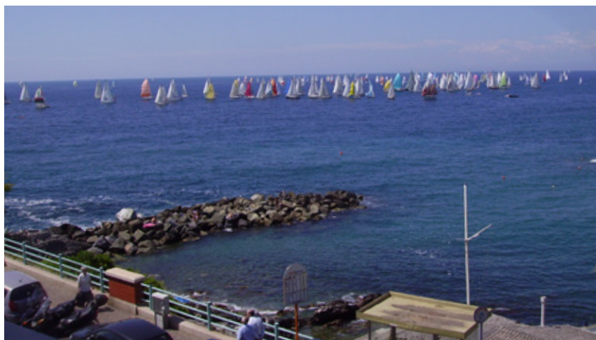
In primo piano il pennello che protegge la spiaggia dallo Scirocco..