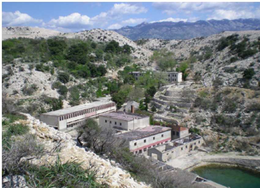
Isola di Goli Otok: il campo di rieducazione

Il regime di Tito li mandò ai lavori forzati nel gulag dell'isola Calva (Goli Otok) insieme ad altre decine di migliaia di sventurati di varie nazionalità per la loro rieducazione politica. Quando, dopo indicibili sofferenze riacquistarono la loro libertà, tornarono in Italia e la loro vicenda fu taciuta per molti anni.