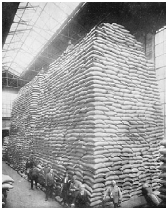
Caffè in Deposito Franco quando Genova era “La Superba”

Ripeto, due dipendenti camerale perché con la scarsa movimentazione di merce che c’era il secondo cresceva e serviva soprattutto a sostituire il primo in caso di malattia e ferie.