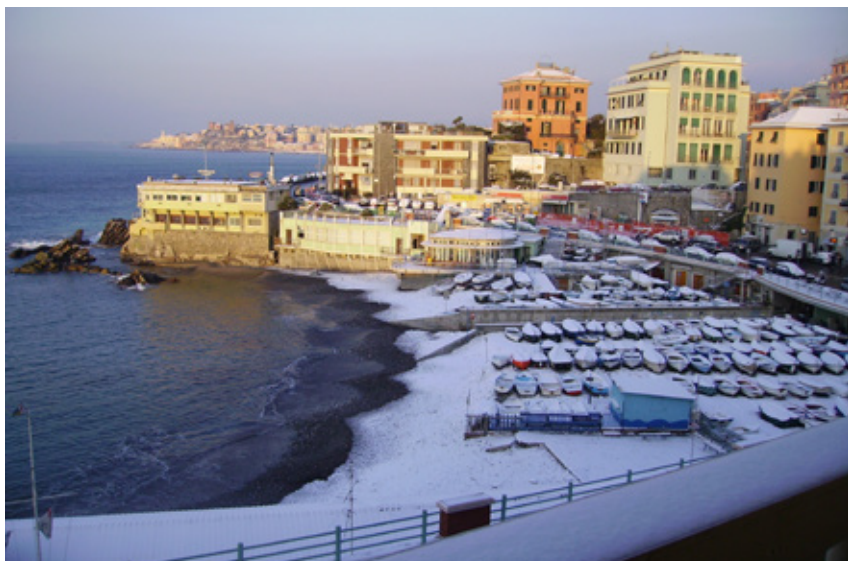
Una visione insolita del golfo di Priaruggia con la sede dell'Unione Sportiva Quarto.