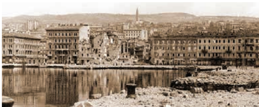
La Riva dei Bodoli, Molo Stocco e Molo San Marco squarciati dalle mine tedesche. In secondo piano la Cripta di Cosala che guarda silenziosa. Il peggio deve ancora venire.