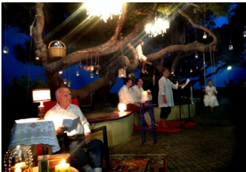
Lettere "Di foglio in foglia" a Bogliasco.