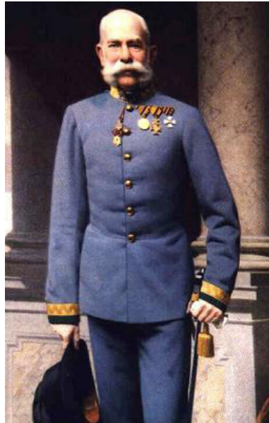
L'Imperatore Franz Joseph

Il Regno d'Italia ha commesso a danno dei suoi due alleati un tradimento di cui la storia non conosce uguale. Dopo un patto d'alleanza che durava da oltre trent'anni, durante i quali ha potuto crescere il suo territorio e conseguire un insperabile benessere, l'Italia ci ha abbandonati nell'ora del pericolo ed è passata a bandiere spiegate nel campo dei nostri nemici. Noi non abbiamo minacciato l'Italia, non abbiamo menomato la sua reputazione, violato il suo onore o i suoi interessi. Noi abbiamo scrupolosamente osservato gli obblighi derivatici dall'Alleanza e accordato la nostra protezione quando l'Italia ha preso le armi. Noi abbiamo fatto di più: quando l'Italia ha diretto i suoi avidi sguardi sui nostri confini, noi, per salvare l'alleanza e la pace eravamo pronti a grandi e dolorosi sacrifici, a sacrifici che toccavano in modo particolare il nostro cuore paterno. Ma non è stato possibile calmare l'avidità dell'Italia, che credeva di dover sfruttare l'occasione. Così deve compiersi il destino.