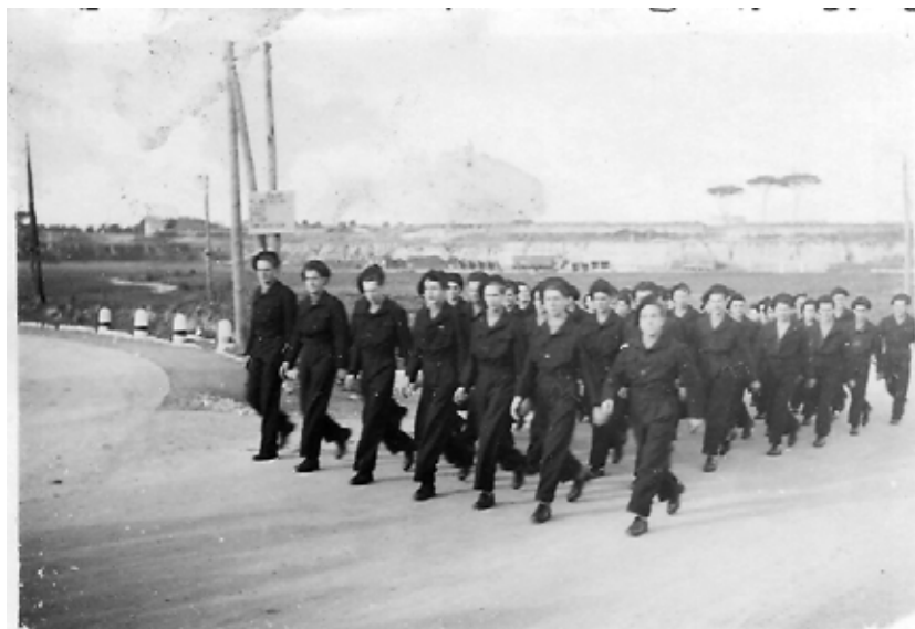
In fila per sei in libera uscita verso Brindisi, cantando.