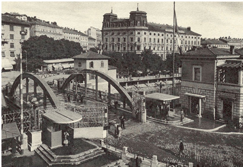
Il ponte di ferro sopra il fiume Eneo che segnava il confine tra Italia e Jugoslavia.