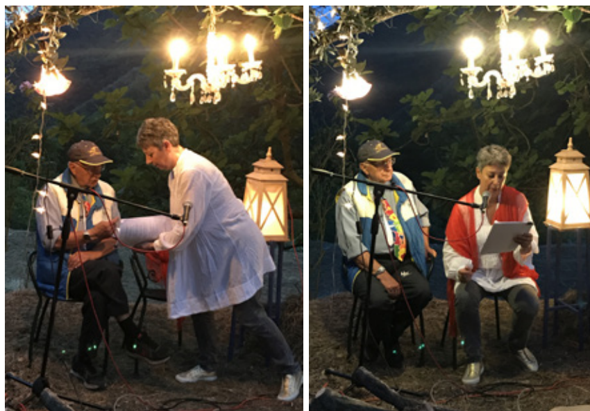
23 giugno 2017. "Ovunque protegge" sul prato Confaunè a Sussisa.