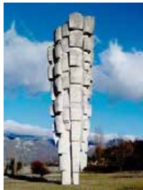
Podhum: Il Monumento che ricorda le vittime.

nella proporzione di “una testa per un dente” con lo scopo di colpire più duramente i civili che davano supporto logistico ai partigiani. Il villaggio fu bruciato e il resto della popolazione deportato a Arbe. Solo 10 km. separavano Fiume da Podhum, ma la notizia non si diffuse nella nostra città e rimase top secret per i soli addetti ai lavori, come pure quella sul campo di concentramento di Arbe. Arrivavano e giravano invece fotografie altrettanto crudeli dei nostri fantaccini oltraggiati dai partigiani di Tito che mostravano i cadaveri di soldati italiani con le stellette conficcate negli occhi,