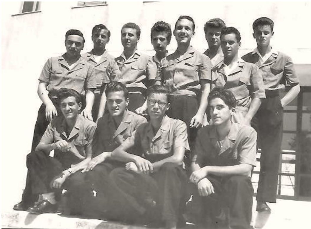
La Vª Scientifico del Tommaseo – luglio 1947