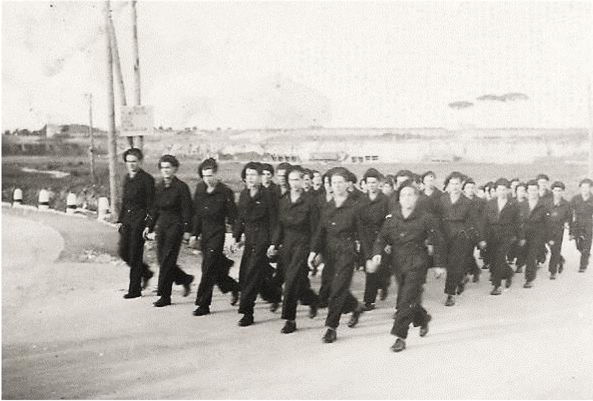
“In fila per sei” dal Tommaseo verso Brindisi in libera uscita - 1947