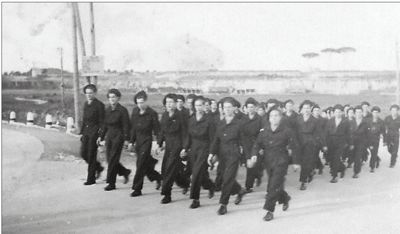
LE IMMAGINI Sopra "In fila per sei" dal Tommaseo verso Brindisi in libera uscita – 1947, sotto 25° Raduno dei Muli del Tommaseo Colle Isarco (BZ) - settembre 2010, Cerimonia a ricordo dei compagni deceduti con lapide e copia del Monumento al Marinaio