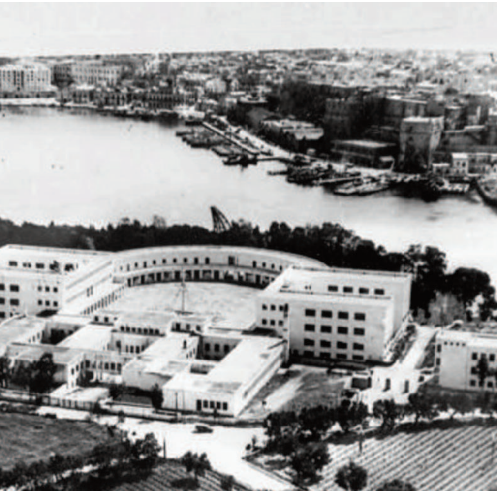
LE IMMAGINI Qui sopra una veduta aerea del Collegio Tommaseo, a sinistra prima dell'alba - pronti per la lezione di navigazione a vela

disina abbiamo già avuto modo di scrivere e raccontare fatti episodi e personaggi in qualche misura legati alla storia del secondo dopoguerra cittadino ed in particolare a quella del Collegio Navale – in origine, dalla sua fondazione nel 1937, della gioventù italiana del littorio GIL e poi, per tre anni dal settembre del '43 al luglio del '46, sede dell'Accademia Navale – credo possa essere interessante ed utile divulgare, pur se con la necessaria sintesi, il racconto di un protagonista di quella nostra pagina di storia, il racconto di uno di quei tanti studenti “li Giuliani”.