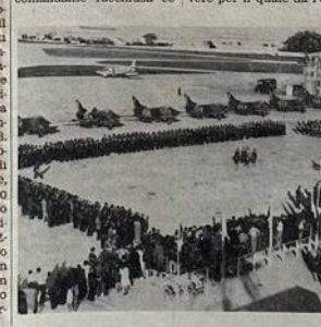
IL MANIFESTO DEL SINDACO A NOME DEI CITTADINI