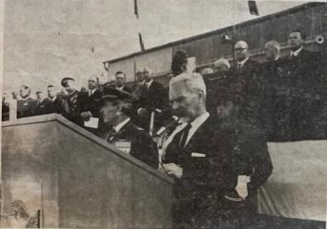
PARLA IL MINISTRO TREMELLONI

«Signori Ufficiali, Sottufficiali, Avieri,