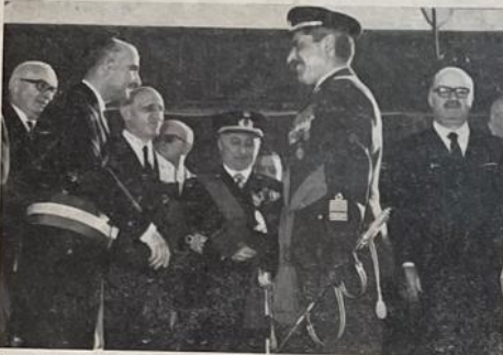
Il Capo di Stato Maggiore dell'Aeronautica dopo aver salutato il Presidente della Commissione Difesa si intrattiene in cordiale colloquio con le Autorità locali

Una splendida giornata primaverile ha fatto da cornice alla manifestazione svoltasi il 24 aprile nell'aeroporto di Brindisi. Alla presenza delle più alte autorità, civili e militari, dello Stato e locali, è avvenuta la consegna della bandiera al ricostituito 32° Stormo caccia bombardieri e ricognitori, di stanza nella nostra città.