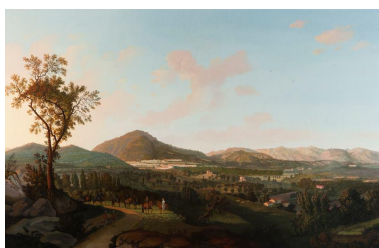
Antonio Veronese (attivo a Napoli dal 1764 – 1829) Veduta della Piana di Lavoro e del villaggio di San Leucio dalla strada del Sommacco, 1818 olio su tela, 142 x 222 cm

Collocazione attuale: Caserta, Palazzo Reale