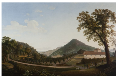
Antonio Veronese (attivo a Napoli dal 1764 – 1829) La Vaccheria di San Silvestro a Caserta con Ferdinando I e il suo seguito, 1818 olio su tela, 145 x 222 cm

Inv. n. 906 [1874]; n. 65 [1905]; n. 1209 [1951-52]; n. 3310 [1977-78]