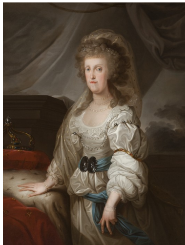
Heinrich Wilhelm Tischbein (Haina, 1751 – Eutin, 1829) La Regina Maria Carolina d'Asburgo, Regina di Napoli e di Sicilia olio su tela, 126 x 97 cm inv. n. 398 [1874]; n. 816 [1905]; n. 1598 [1951 – 52]; n. 226 [1977 – 78] Collocazione attuale: Caserta, Palazzo Reale