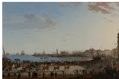
Antonio Veronese (attivo a Napoli dal 1764 – 1829) Passeggiata in carrozza di Ferdinando I per la marina di Napoli, 1818 olio su tela, 142 x 222 cm Inv. n. 907 [1874]; n. 387 [1905]; n. 1208 [1951-52]; n. 3311 [1977-78] Provenienza: Real Villa Favorita di Resina (Ercolano) Collocazione attuale: Caserta, Palazzo Reale