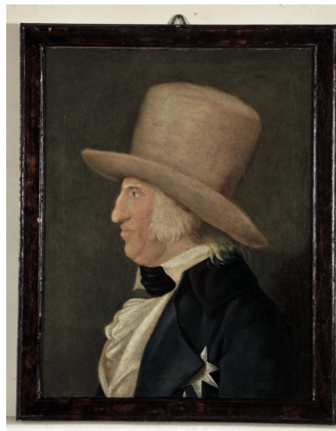
Giuseppe Cammarano (Sciacca, 1766 – Napoli, 1857), attr., Ferdinando I di Borbone, Re delle due Sicilie olio su tela, cm 69x56, inv. n. 744 [1977-78] Collocazione attuale: Caserta, Palazzo Reale