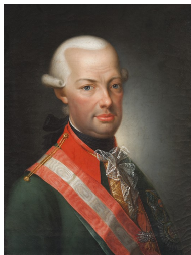
Josef Hickel (Bohmisch, Leipa, 1736 – Vienna, 1807) Pietro Leopoldo Granduca di Toscana poi imperatore Leopoldo II, fratello di Maria Carolina regina di Napoli olio su tela, cm 69x56, inv. n. 875 [1977-78] Collocazione attuale: Caserta, Palazzo Reale