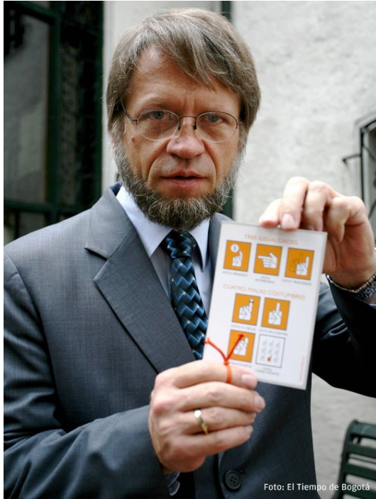
Antanas Mockus-Sindaco di Bogotá