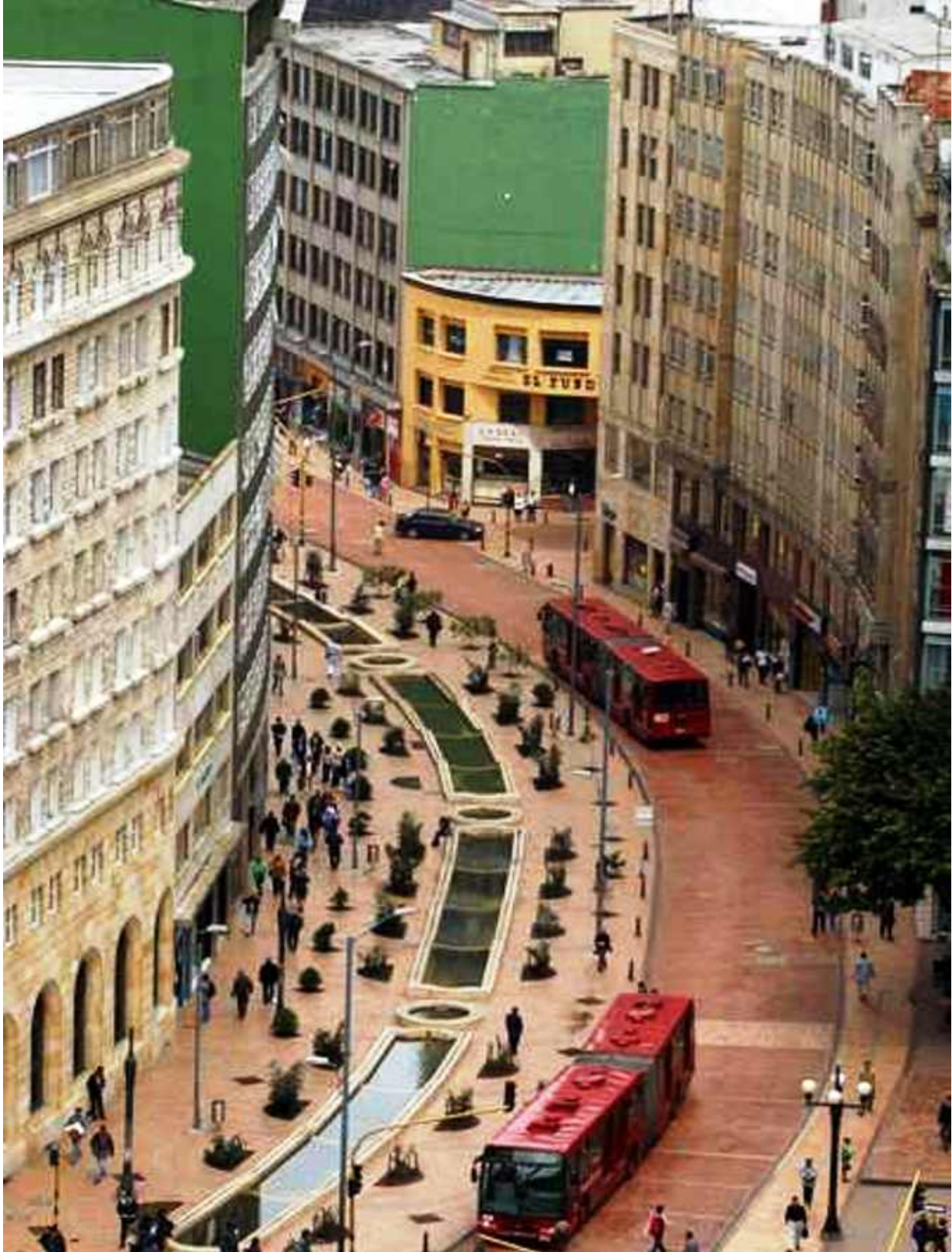
Bogotá - Capitale della Colombia