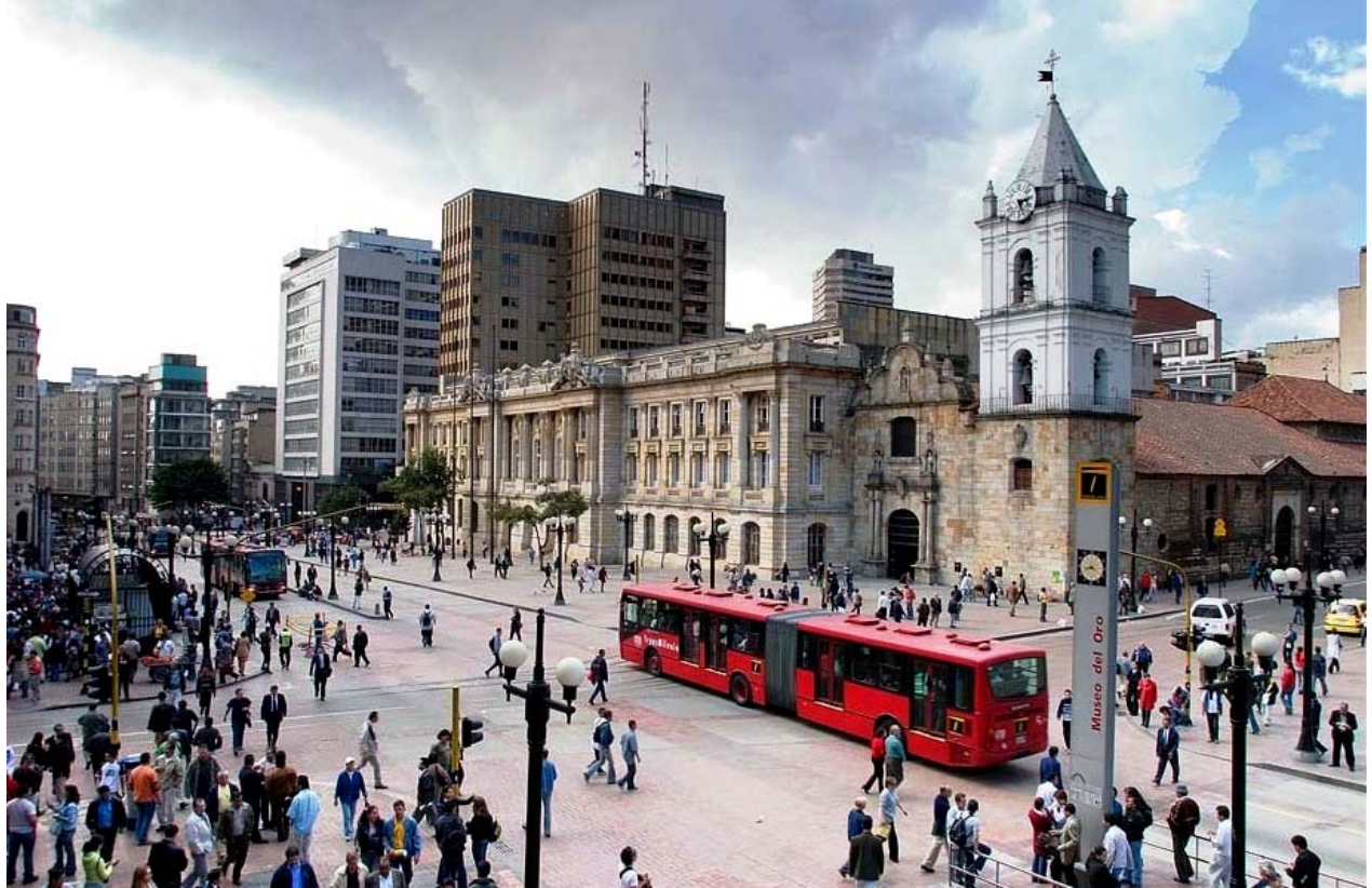
Bogotá – Capitale della Colombia