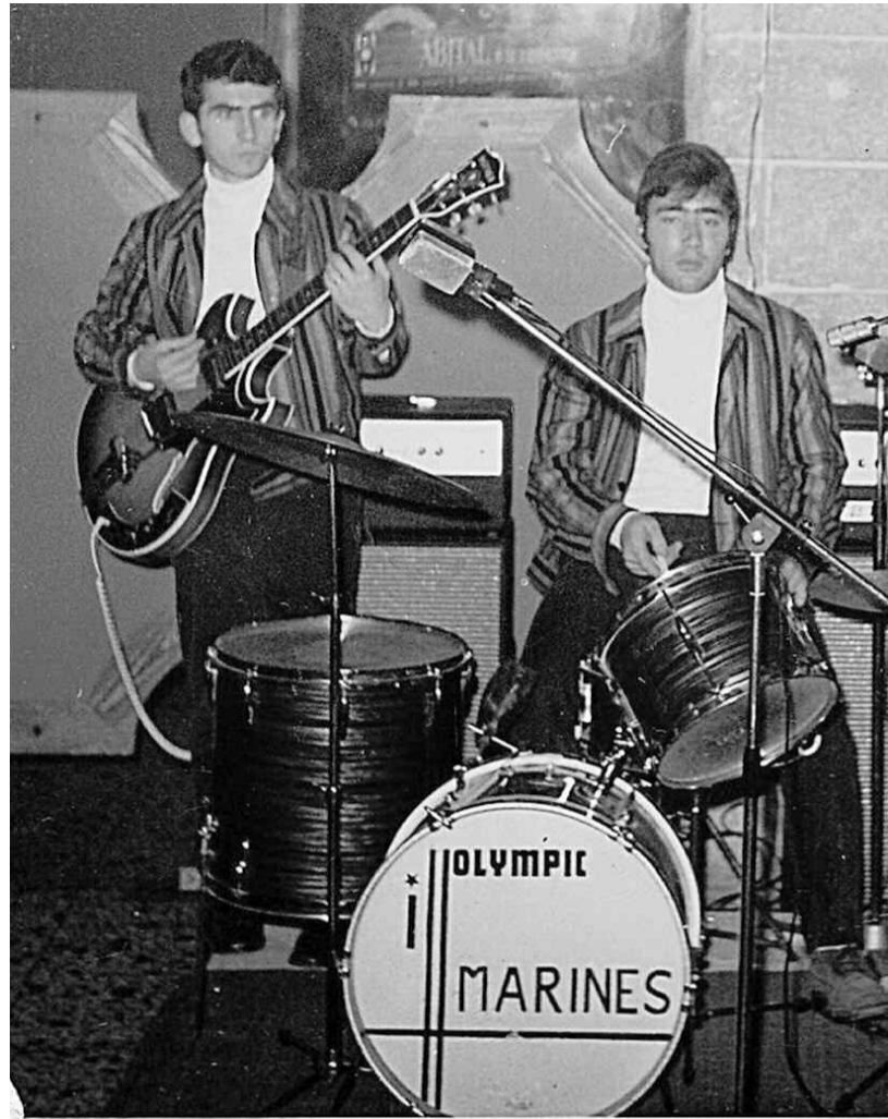
Ancora un'immagine dei