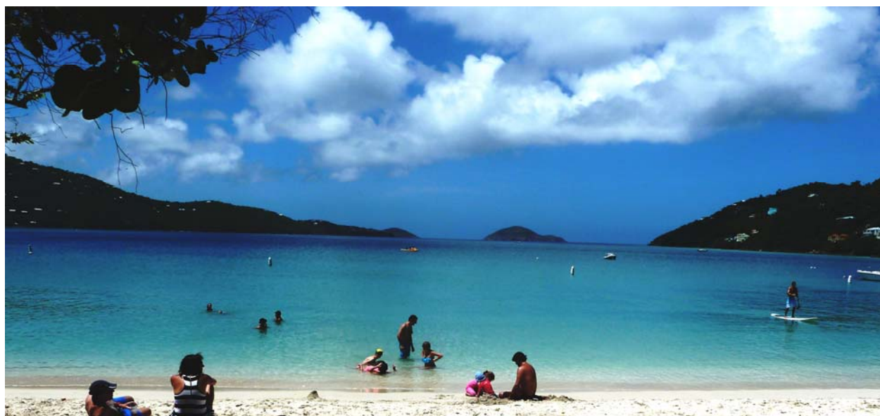
Bay Beach nell’isola caraibica di San Thomas - Isole Vergini Americane

“QUESTA E’ LA LEGGE”: Una frase laconica ma di un profondo significato per gli statunitensi. E per noi?